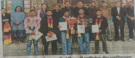
अंतर महाविद्यालय हैडबाल प्रतियोगिता की उपविजेता टीम महाविद्यालय बिलासपुर के खिलाड़ी व उपस्थित अन्य।