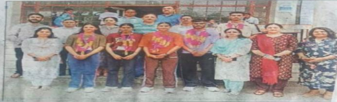
मैराथन प्रतियोगिता में विजेता खिलाड़ियों को सम्मानित करते बिलासपुर कॉलेज के प्रोफेसर।