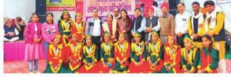
प्रथम स्थान प्राप्त करने वाले राजकीय महाविद्यालय बिलासपुर की टीम मुख्यातिथि के साथ।

बिलासपुर, 18 नवंबर : भाषा-संस्कृति विभाग बिलासपुर द्वारा जिला स्तरीय लोक नृत्य प्रतियोगिता का आयोजन बिलासपुर जिले के दयोध स्थान पर किया गया। इस आयोजन में जिले भर के आठ सांस्कृतिक दलों ने भाग लिया। प्रतियोगिता में राजकीय महाविद्यालय बिलासपुर के कलाकारों ने प्रथम स्थान प्राप्त किया जबकि दूसरा स्थान महालक्ष्मी सांस्कृतिक दल को